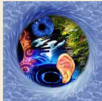
(2º Y 3º ciclo de primaria)

Insistir en que ninguén ten dereito a facer dano a outra persoa, con ningún tipo de escusa, só en defensa propia, cando queren matarte ou provocarche danos e por algún exemplo.