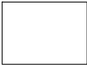
(fotografía del alumno)